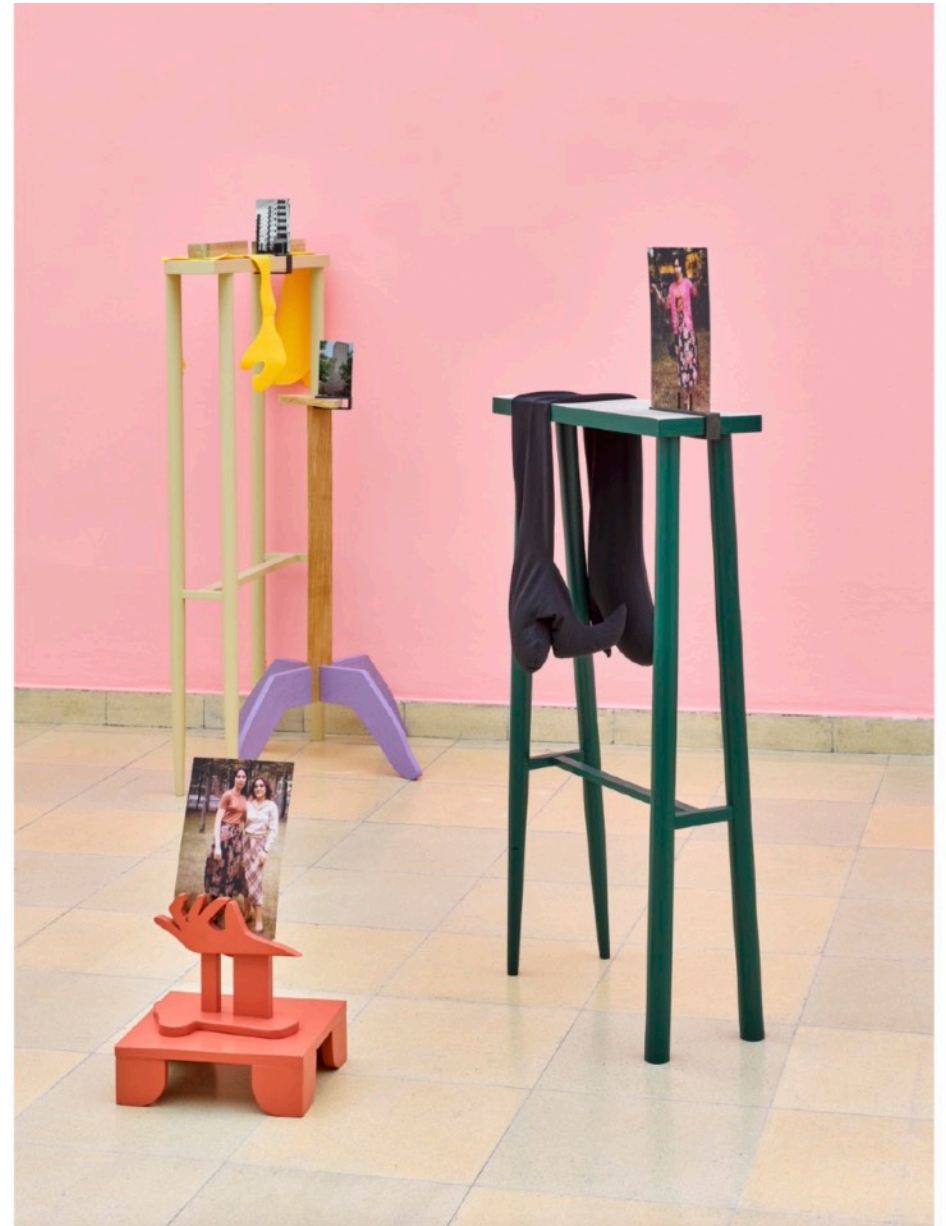
Titel Fichtengarten Wernerwerk XV u.a.