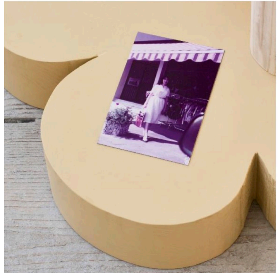
© Ahu Dural, Gesamtansicht Kaufmitte (Var. 01), 2025, Skulptur, Bildhauerwerkstatt des BBK, Berlin, Foto: Joe Clark

© Ahu Dural, Ensemble aus Saatwinkler Tisch (Var. 02), 15 Years (Var. 2), Hocker Siemensstadt , Hocker Kaufmitte , 2025, Skulpturen, Bildhauerwerkstatt des BBK, Berlin, Foto: Joe Clark