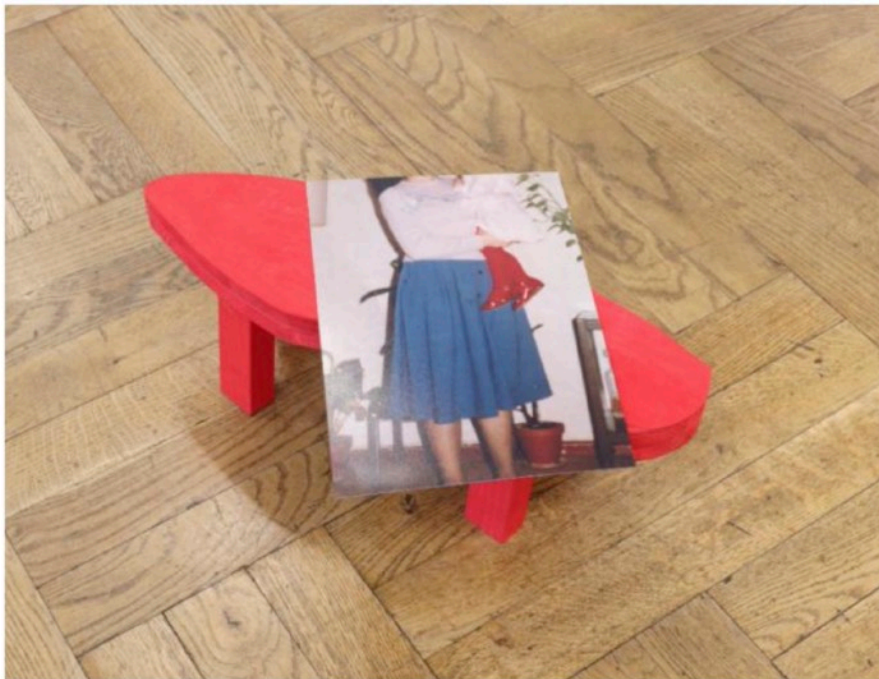
Titel Roter Lackschuh (Berlin-Moabit)