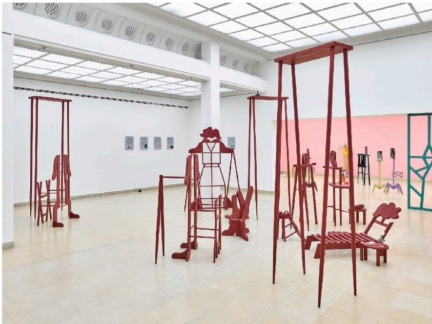
© Ahu Dural, Ausstellungsansicht Frau Monteurin / Kadın Montajcı, Installation mit ca. 45 Werken, 2025, Kunstpavillon Innsbruck, Foto: West Fotostudio, 2025