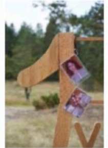
Titel Figurenobjekt (Var. 01)