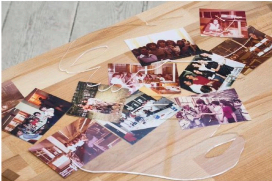
Titel Ensemble aus Saatwinkler Tisch (Var. 02), 15 Years (Var. 2), Hocker Siemensstadt , Hocker Kaufmitte